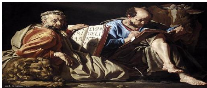
Geloven in Ontmoeting in De Ronde Venen 2018 - 2019