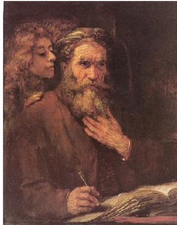
'De evangelist Matteüs en de engel' Rembrandt van Rijn

Leest u weer met mij mee? Ook nu verheug ik me erop!